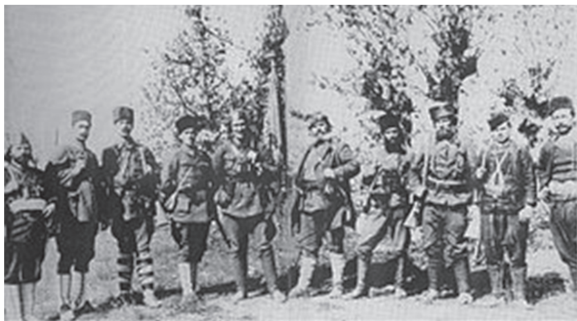
Ръководството на българо-турското опълчение в Западна Тракия в началото на 20-те години на миналия век

на образуване и преминаване на чети от крайграничните български територии в Западна Тракия.