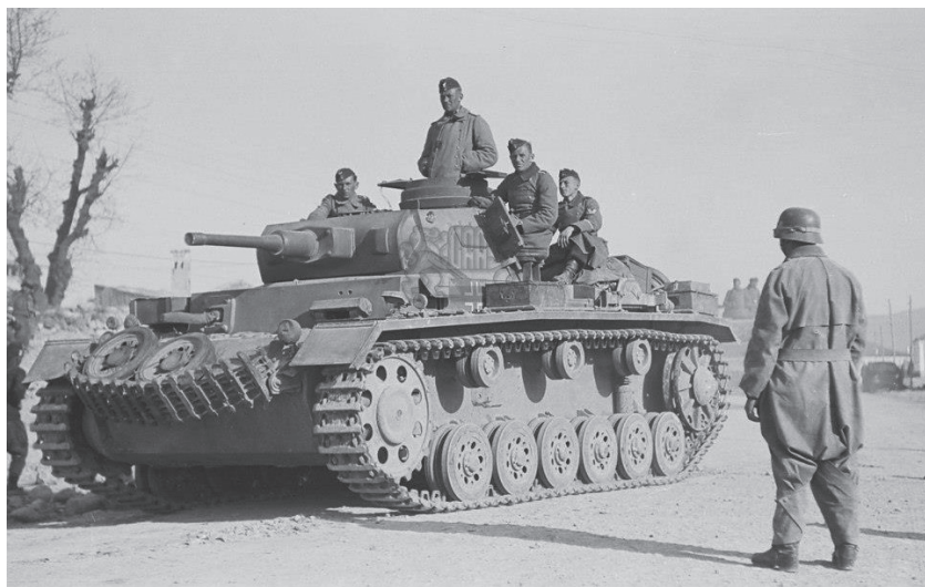
Нахлуването на германските войски в Гърция, април 1941 г.