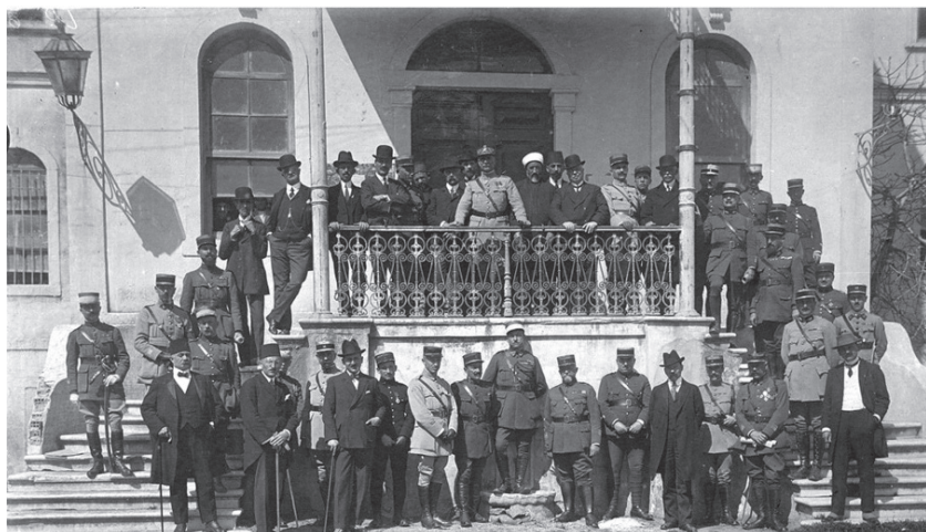
Висшият административен съвет на Западна Тракия начело с ген. Шарпи, Гюмюрджина, април 1920 г.

дат турският и българският. 3. Режимът на автономната област да се определи окончателно от местното българско и турско население чрез референдум, проведен от временно правителство, съставено от турци и българи. 4. С общи усилия да се окаже въоръжена съпротива на гръцката окупационна армия и 5. Към края на май 1920 г. да се свика съвместен конгрес с цел да се избере временно правителство и да се вземат конкретни мерки по организирането на въоръжената борба. 12