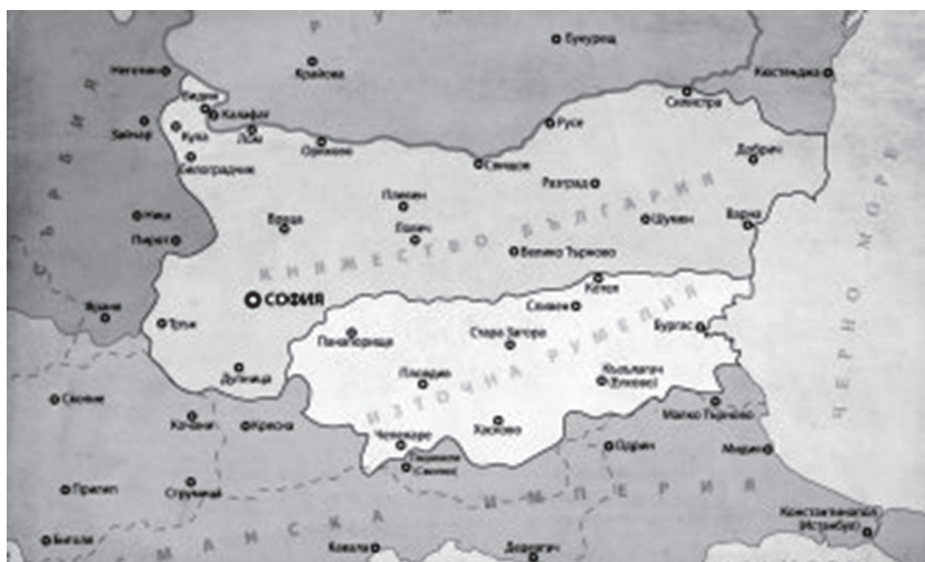
Карта на България (1878-1885), определена от Берлинския договор

Стремешът на балканските държави да присъединят Източна и Западна Тракия към своите територии създава дългогодишно напрежение в региона, придружено с формиране на различни съюзи и държавни образувания, с кръвопролития, репресии на местното различно по състав население и прогонването на българите извън областта. Предложената статия има за цел да проследи хронологично събитията, случващи се в Западна Тракия, да изясни характера на различните временни управления, предизвикали като краен резултат разорението и прогонването на българите от областта.