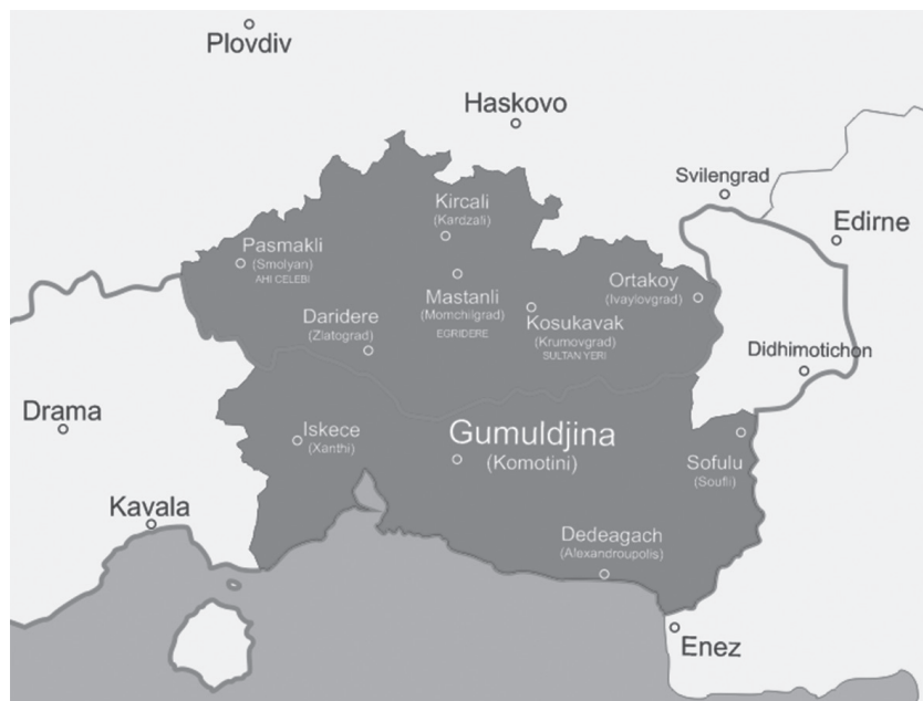
Карта на територията на Гюмюрджинската република, 1913 г.

на войните и бяло - успеха на въстанието и свободата. Временното управление сформира войска и подготвя държавен бюджет. Евреинът Самуел Карасо получава задачата да основе паспортно бюро и да издава вестник „Мюстакли“ (Независимост) на два езика - турски и френски. Законите и регулациите на Османската империя са приети без никакви промени и делата се гледат от Съда на Западна Тракия.