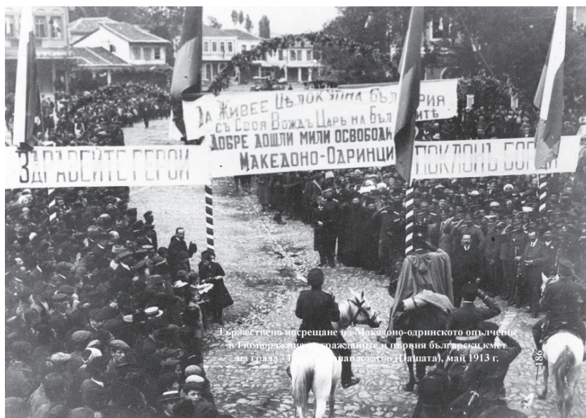
Тържествено посрещане на Македоно-одринското опълчение в Гюмюрджина, 1913 г.

Гюмюрджинската република просъществува около два месеца но успява с оръжието, доставено от Одрин и Гърция, и с военни инструктори да събере 29 170 души армия предимно от пехотинци под командването на Сюлейман Аскер, да организира башибозук, командван от Сюлейман бей, които подлагат българското население на грабежи и масови кланета. Разорени са множество български селища в Източните Родопи и Беломорска Тракия, сред които Сачанли, Манастир, Черничево, Гьокчебунар, Покрован, Хухла, Гугутка, Попско, Драбишна, Горно Луково, Долно Луково, Башклисе и други.