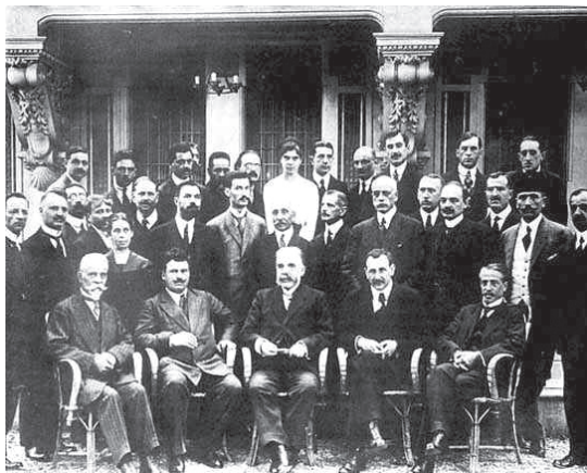
Българската делегация, подписала Ньойския мирен договор, 1919 г.