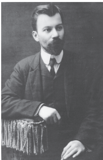
Д-р Страшимир Дочков, министър на пощите, телеграфа и земеделието

на националната защита, както и ключовите постове, които те поемат.