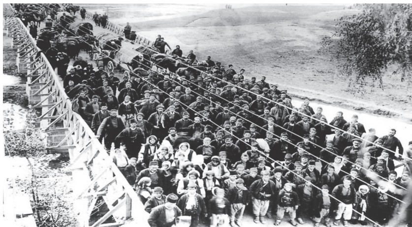
Колоната от български бежанци на път към границата

ва да навлиза на българска територия. Настъпват важни събития на Балканите, които разрушават създадения от победителките в Първата световна война ред.