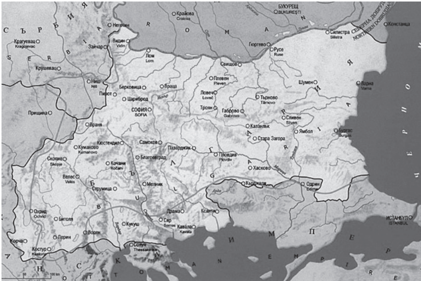
Карта на Санстефанска България

Западна или Беломорска Тракия се простира между Места, Марица и първите склонове на Родопите върху 8578 кв. км. площ. Плодородна, гъсто заселена област, през вековете тя преживява много бурни събития, но особено драматична е съвременната ѝ история. През 1878 г. Санстефанският договор включва част от Беломорието в новоосвободена България. Със своите решения Берлинският конгрес връща тези територии на Османската империя и принуждава местното българско население да поведе упорита многогодишна борба за включване на областта в българските предели.