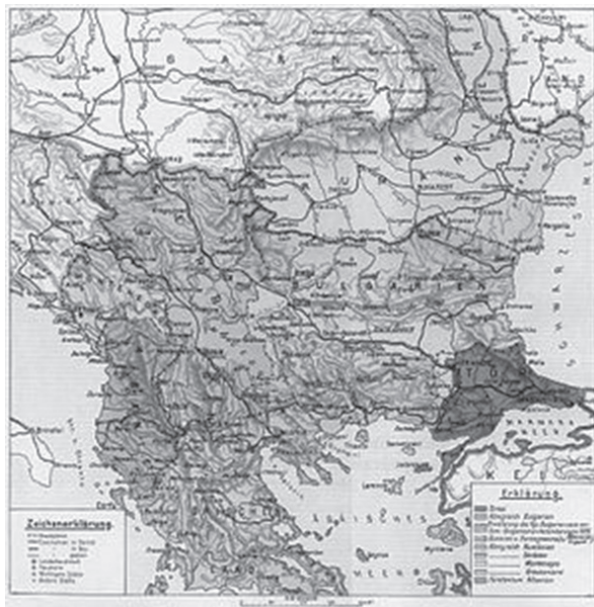
Поправката на границата според Българо-турската конвенция, 1915 г.

Софийската конвенция осигурява на България територия от 2588 квадратни километра по десния бряг на река Марица, включително гарата на Одрин - Караагач, и град Димотика (днес Дидимотихо, Гърция), както и една ивица по левия бряг на реката в дълбочина от 2 километра. Така страната ни получава пълен контрол върху линията Свиленград - Дедеагач, част от която дотогава минава през османска територия, а Марица се превръща в изцяло българска река. С тази стъпка още преди да започне реално военни действия България постига най-голямото си териториално разширение в новата си история. Тя получава 114 425 квадратни километра с над 160 населени места, между които градовете Караагач (жп гарата на Одрин), Димотика и Кулели Бургас,