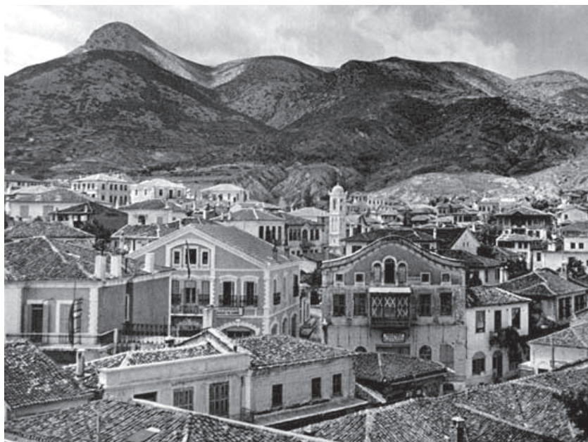
Град Ксанти – център на българската Беломорска област

светът ще ни смятат за лоши стопани и организатори...”