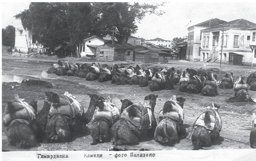
Гюмюрджина Камели

На 28 юли 1913 г. тежката военна обстановка на четирите фронта принуждава България да поиска примирие. Българските войски се оттеглят от Западна Тракия, което дава възможност няколко дена по-късно, на 31 август, представители на местните турци и помаци, подкрепяни от Турция и Гърция, да обявят създаването на Независимо западнотракийско управление, наречено по-късно Гюмюрджинска република. За централен град е определен Гюмюрджина (днес Комотини).