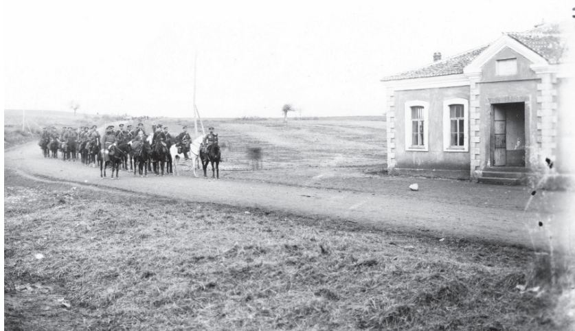
Пристигането на българските войски в Гюмюрджина, ноември 1912 г.

Още с встъпването си в длъжността на военен губернатор на 10 ноември 1912 г. Вазов се обръща с позив към населението на освободена Тракия. В него се подчертава желанието на българското правителство мирните жители „без разлика на вяра, народност и състояние, да се ползват с всички права и облаги”, с които се ползват и останалите „верни поданици в Царство България.” Военният губернатор не само обещава равноправие, но и напомня на гражданите задължението — да се подчиняват безпрекословно на законите и да изпълняват разпорежданията на поставените власти. 2