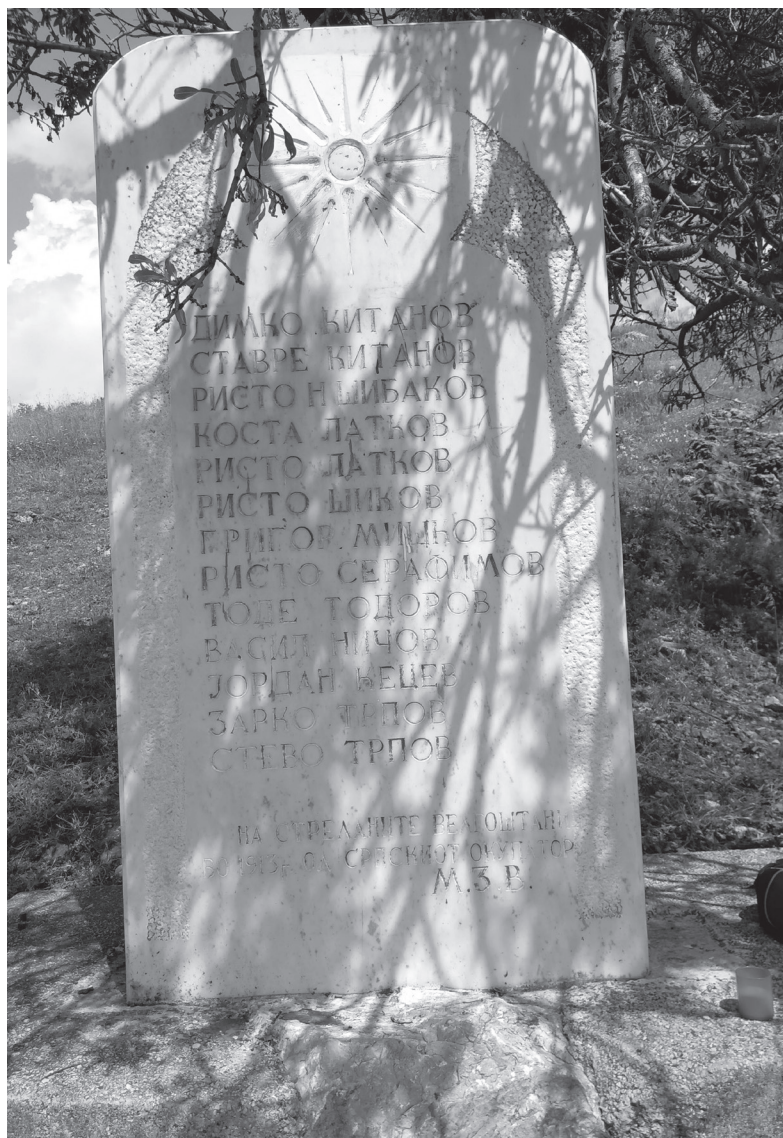
Паметникът на убитите от сръбските окупатори през 1913 г. 13 българи от село Велгощи, Охридско